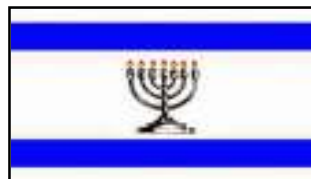
La Verdadera Bandera de Israel

Escuela Hebraica Apartado Postal 281 Añasco, PR 00610 hebraica@gmail.com www.sendaantigua.com