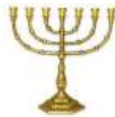
Símbolo Bíblico de Israel

Fuente: Libro The Six-Pointed Star (La Estrella de Seis Puntas), por O. J. Graham.